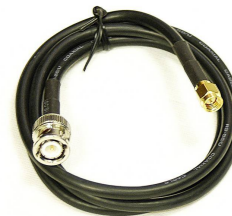
сетевой адаптер и кабель SMA-BNC (дополнительная комплектация)