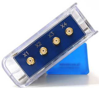
на пьедестале АНА-1288