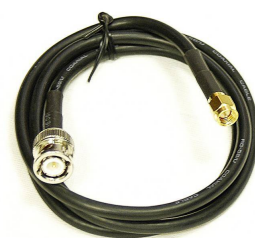
сетевой адаптер и кабель SMA-BNC (дополнительная комплектация)

Для этого прибора после его регистрации с указанием серийного номера доступно для загрузки/прочтения: