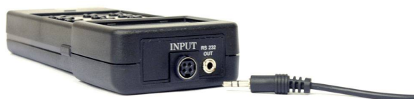
RS-232 и jack 3,5 мм