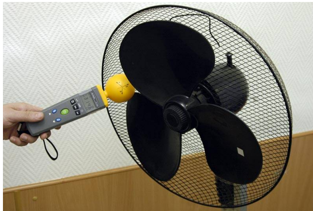
Измерение напряженности электрического поля выключенного вентилятора ("естественный" фон). Максимальное значение составляет 314,6 мВ/м