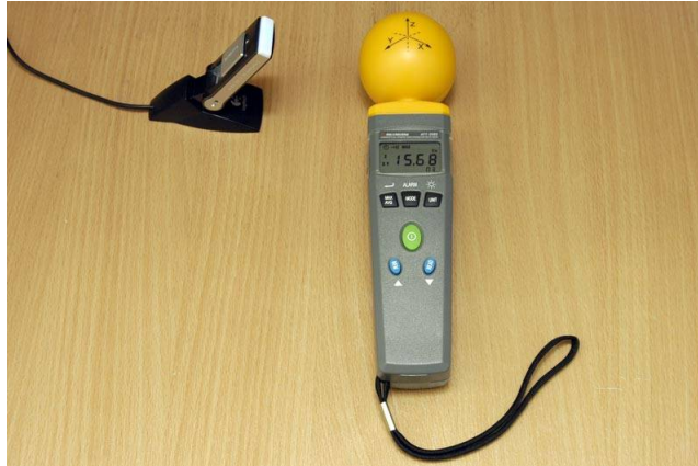
Измерение напряженности электрического поля Yota WiMax. Максимальное значение составляет 15,68 В/м