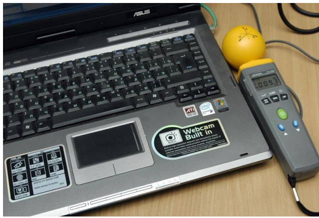
Измерение напряженности электрического поля ПК с выключенным Wi-Fi ("естественный" фон). Максимальное значение составляет 9,3 мВ/м