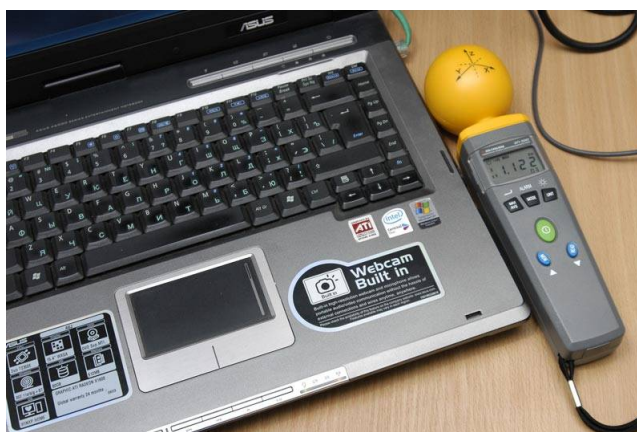
Измерение напряженности электрического поля ПК с включенным Wi-Fi. Максимальное значение составляет 1,122 В/м