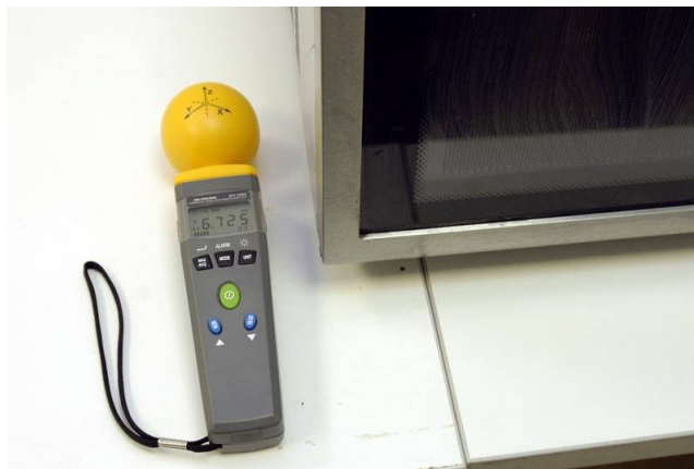
Измерение напряженности электрического поля СВЧ печи. Максимальное значение составляет 6,725 В/м