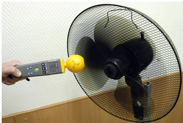
Измерение напряженности электрического поля включенного вентилятора. Максимальное значение составляет 325,4 мВ/м

Из проведенных измерений наглядно видно, какие тестируемые устройства наиболее вредны с точки зрения излучаемого высокочастотного электромагнитного поля. Причем, обращаем внимание, что работающий вентилятор и персональный компьютер без включенных излучающих устройств НЕ ЯВЛЯЮТСЯ объектами измерения для АТТ-2592 и АТТ-2593, т.к. они работают на частотах 50 Гц, что в миллион раз ниже заявленного диапазона измерения. Измерители электромагнитного фона АТТ-2592 и АТТ-2593 являются уникальными приборами, благодаря которым любой пользователь может измерить электромагнитную обстановку вокруг себя. Порой достаточно переставить один источник излучения или даже просто развернуть его и ситуация может значительно измениться. Например, в момент дозвона сотовый телефон необходимо держать таким образом, что бы встроенная антенна телефона была направлена в сторону, а сам телефон находился на некотором удалении от головы. Даже какие - то 20 - 30 см существенно меняют картину.