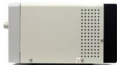
AVA-1810 Амплитудный усилитель - вид сбоку