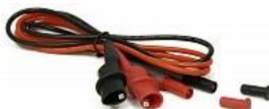
AVA-1810 Амплитудный усилитель - кабель соединительный с зажимом типа "крокодил"