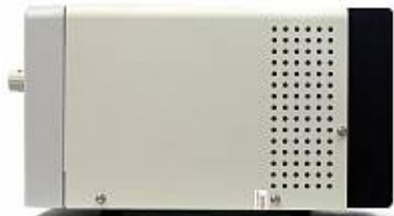
AVA-1810 Амплитудный усилитель - вид сбоку