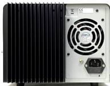
AVA-1810 Амплитудный усилитель - вид сзади