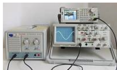
AVA-1810 Амплитудный усилитель - контроль усиленного сигнала