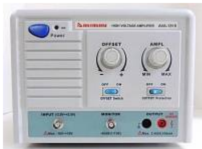
AVA-1810 Амплитудный усилитель - лицевая панель

Комплектация прибора может быть изменена производителем без предупреждения. Все заявленные функциональные возможности остаются без изменений.