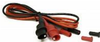
AVA-1810 Амплитудный усилитель - кабель соединительный с зажимом типа "крокодил"

Для этого прибора после его регистрации с указанием серийного номера доступно для загрузки/прочтения: